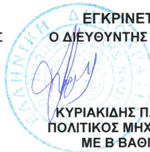
ΚΥΡΙΑΚΙΔΗΣ ΠΑΥΛΟΣ ΠΟΛΙΤΙΚΟΣ ΜΗΧΑΝΙΚΟΣ ΜΕ Β ΒΑΘΜΟ