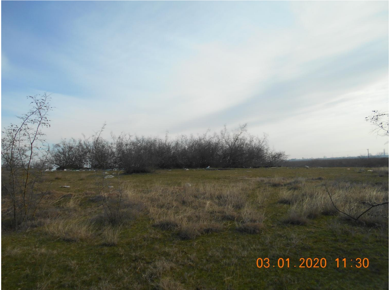
Εικ. 2: Γήπεδο εγκατάστασης Καταφύγιου Αδέσποτων Ζώων

Το γήπεδο, όπου πρόκειται να εγκατασταθεί το καταφύγιο, αποτελεί τμήμα του υπ' αριθμόν 1Γ αγροτεμαχίου του αγροκτήματος Πολυπλατάνου, συνολικού εμβαδού 711.496,48μ 2 . Το εμβαδόν του συγκεκριμένου τμήματος, με στοιχεία Α,Β,Γ,Δ,Ε,Ζ,Α, είναι 5.000,07μ 2 και η περίμετρος του 284,97μ και δεν συνορεύει με άλλον χώρο. Πρόκειται για αδιαμόρφωτο χώρο, στο οποίο δεν υπάρχει κτίσμα και κάποιο είδος καλλιέργειας.